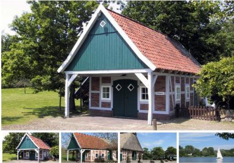
Backhaus am Vörder See